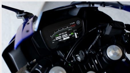
Tableau de bord TFT 5 pouces inspiré de la R1

Le tableau de bord TFT couleur de 5 pouces inspiré de la R1 vous fournit des informations claires et renforce le caractère haut de gamme et le niveau d'équipement exceptionnel de la R125. Sélectionnez l'un des thème « Street » ou « Track » selon la situation de pilotage et ajustez facilement le témoin de changement de vitesse programmable et la plage du compte-tours par incréments de 200 tr/min en fonction de votre style de pilotage et de vos préférences personnelles.