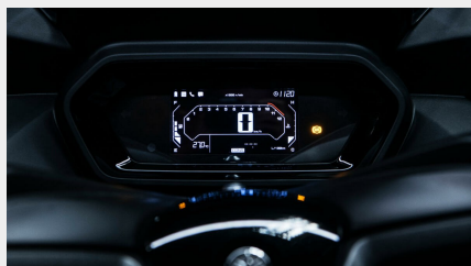
Tableau de bord LCD de 4,3 pouces

Le XMAX 125 est équipé d'un tableau de bord LCD élégant de 4,3 pouces qui affiche l'état de la machine et les informations de fonctionnement dans un format clair et facile à lire. Au-dessus du compteur de vitesse numérique central se trouve un compte-tours, affichant des icônes pour le carburant et la température du moteur de chaque côté.