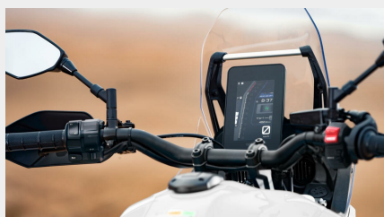
Tableau de bord avec écran TFT 5 pouces couleur connecté à votre smartphone

Le silencieux slip-on Akrapovič léger allie les performances, un look rallye et une sonorité grave, sans être pour autant bruyant. Il est homologué et intègre une protection thermique, un collier de fixation en carbone, ainsi qu'un embout « DB Killer » non amovible.